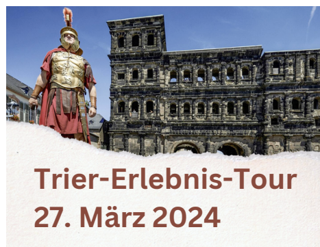
Trier-Erlebnis-Tour 27. März 2024

Kosten: 15 Euro Anmeldeschluss: 11. März 2024