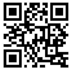
App Pastoraler Raum Betzdorf