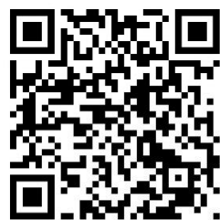
Homepage Pastoraler Raum Betzdorf

Redaktionsschluss für die August Ausgabe: 15.07.2026, 12:00 Uhr